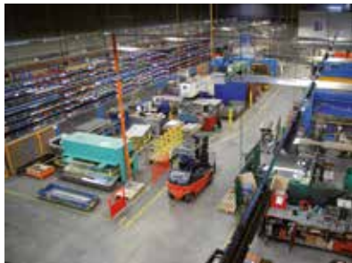
Site de production