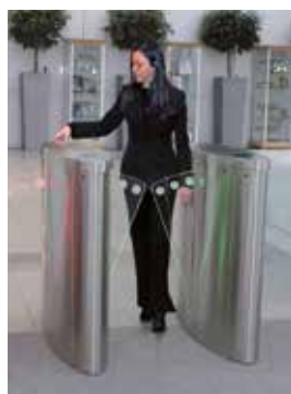
Couloir rapide ou tripode