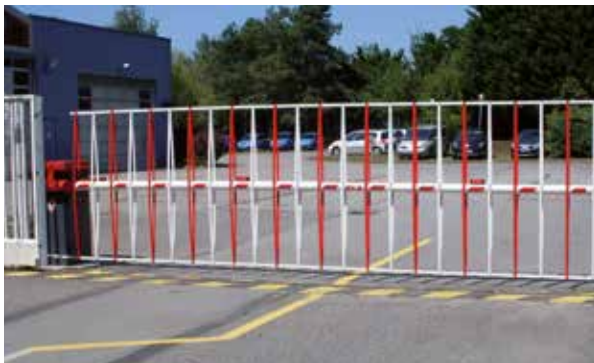
Barrière avec option anti-franchissement