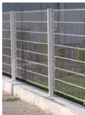
Clotûre en panneau rigide