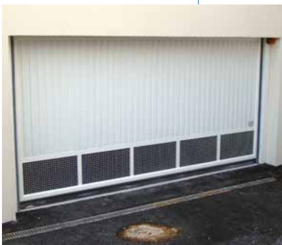
Porte de garage basculante

Un seul interlocuteur pour gérer l'ensemble de vos portes et accès de bâtiments.