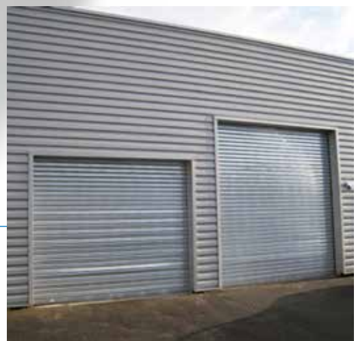
Rideau métallique standard ou isolé