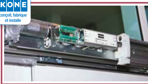
Modernisation de porte piétonne coulissante : Retrofit Kit KONE