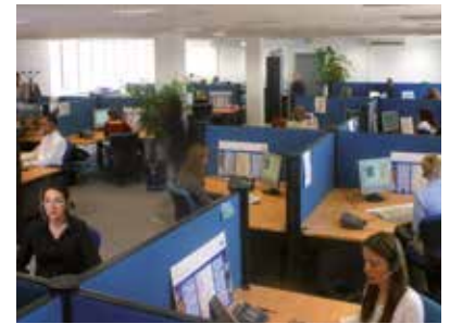
Centre de Contact Client KONE