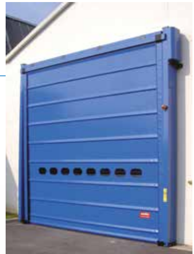
Porte souple rapide