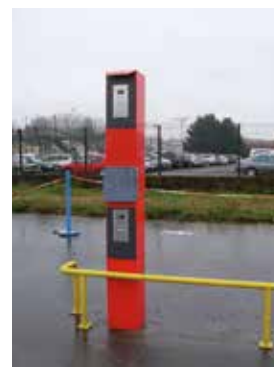
Platine d'appel sur potelet voitures / poids lourds