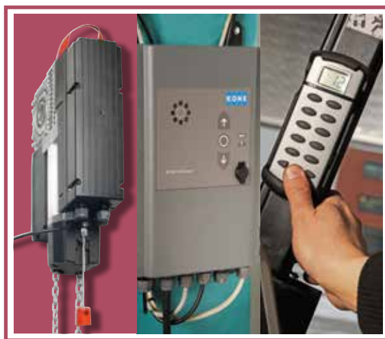
Modernisation porte sectionnelle : Kit KONE Unipower