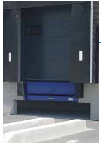
Niveleur de quai