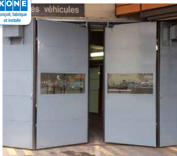
Porte de garage accordéon