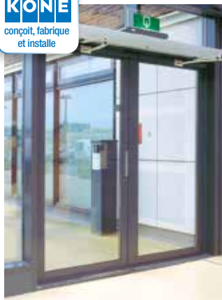
Porte piétonne battante