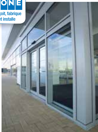
Porte piétonne coulissante