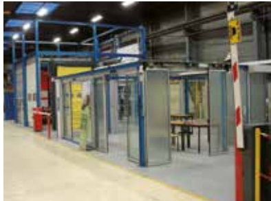
Centre de formation